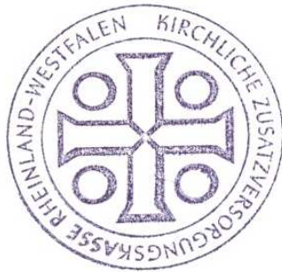
Abbildung des Siegels der Kasse (§ 2 Abs. 1)